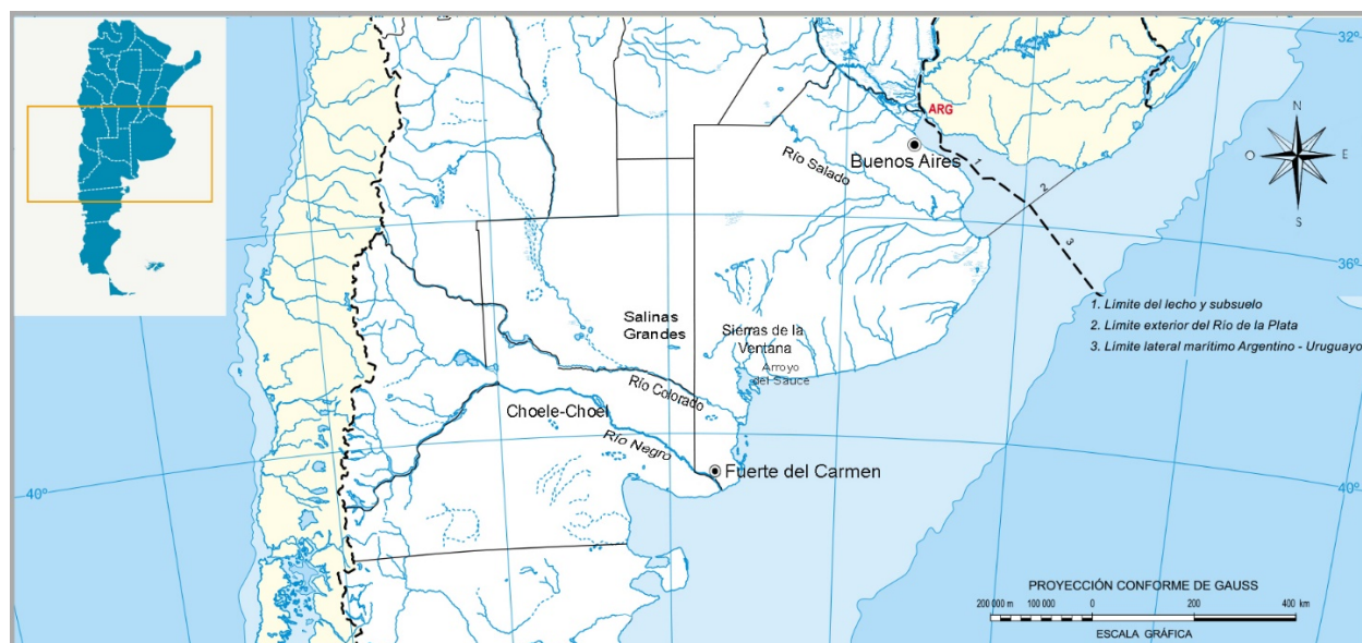
Figura 1. Mapa del área de estudio con ubicación de los sitios relevantes.

sociales (Nacuzzi y Lucaioli, 2017; Zusman, 2001), donde se plasmaron las estrategias de cada grupo para controlar estos espacios en disputa. Dichas estrategias han sido estudiadas en distinta medida por Mandrini (1986, 1992), Palermo (1988, 2000), Crivelli Montero (1991), Nacuzzi (1991, 1998, 2014), Madrid (1991), Nacuzzi y Pérez (1994) y Navarro Floria (2000), respecto de finales del periodo colonial, y por Villar (1993), Irurtia (2006), Mandrini et al. (2007), Cacopardo (2007) y Lanteri y Pedrotta (2012), en relación con el siglo XIX. No obstante, las territorialidades indígenas en la región pampeano-norpatagónica no fueron abordadas a la luz de declaraciones del tipo analizado aquí como expresión de paisajes en tensión (Enrique, 2018).